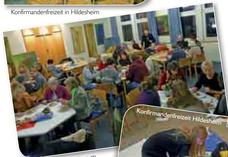
Philippinische Suppe zum Weltgebetsstag