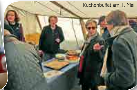
Kuchenbuffet am 1. Mai