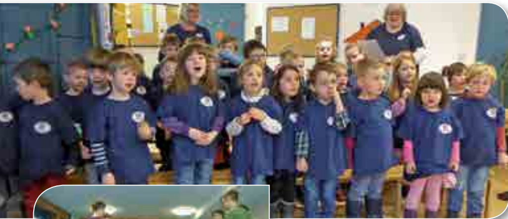
Familiengottesdienst im Kindergarten Arche Noah