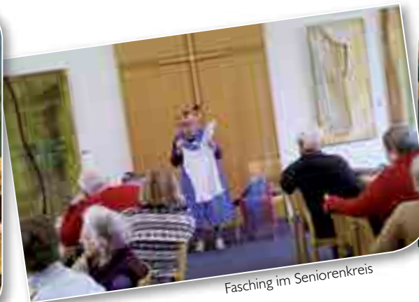
Fasching im Seniorenkreis