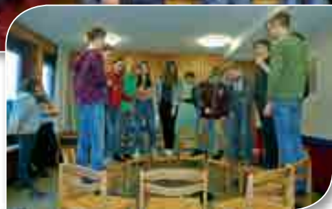
Konfirmandenfreizeit in Hildesheim