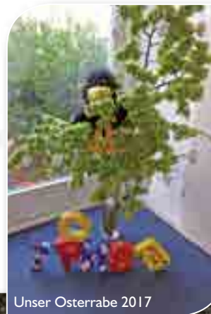
Unser Osterrabe 2017