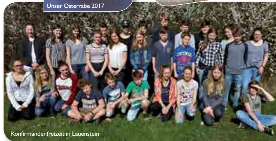
Konfirmandenfreizeit in Lauenstein